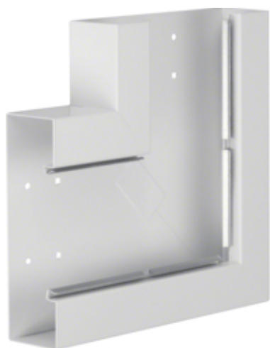
Cot plan BRS65210B, otel, RAL9010