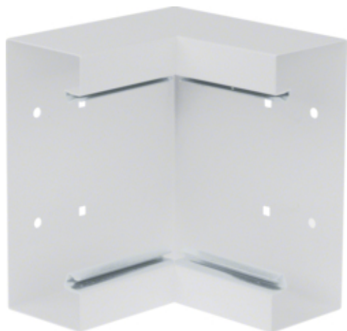
Cot interior BRS65170B, oțel, RAL9010